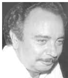
γράφει ο Αντώνης Π. Ξένος