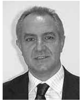
Γράφει ο Παναγιώτης Σκληρός

Αυτός λοιπόν ήξερε αλλά ΟΛΟΙ οι μεγαλόσχημοι υπουργοί που αυτές τις ημέρες κυριολεκτικά εμφανίζονται στα ΜΜΕ σφιχτοδεμένοι με χτυπητές γραβάτες και ζητούν εξή-