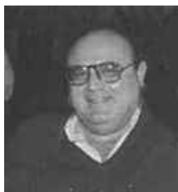
Γράφει ο Διονύσιος Μαρίνος - Κουρής

Είναι γεγονός πως το παρόν είναι πάντα ζωντανό, ενώ το παρελθόν και το μέλλον φαίνονται σαν Μύθος. Το κυκλοφοριακό και άλλα προβλήματα, που απασχολούν σήμερα την πόλη μας, επισκιάζουν το ιστορικό της παρελθόν, το οποίο πολλά μπορεί να μας διδάξει.